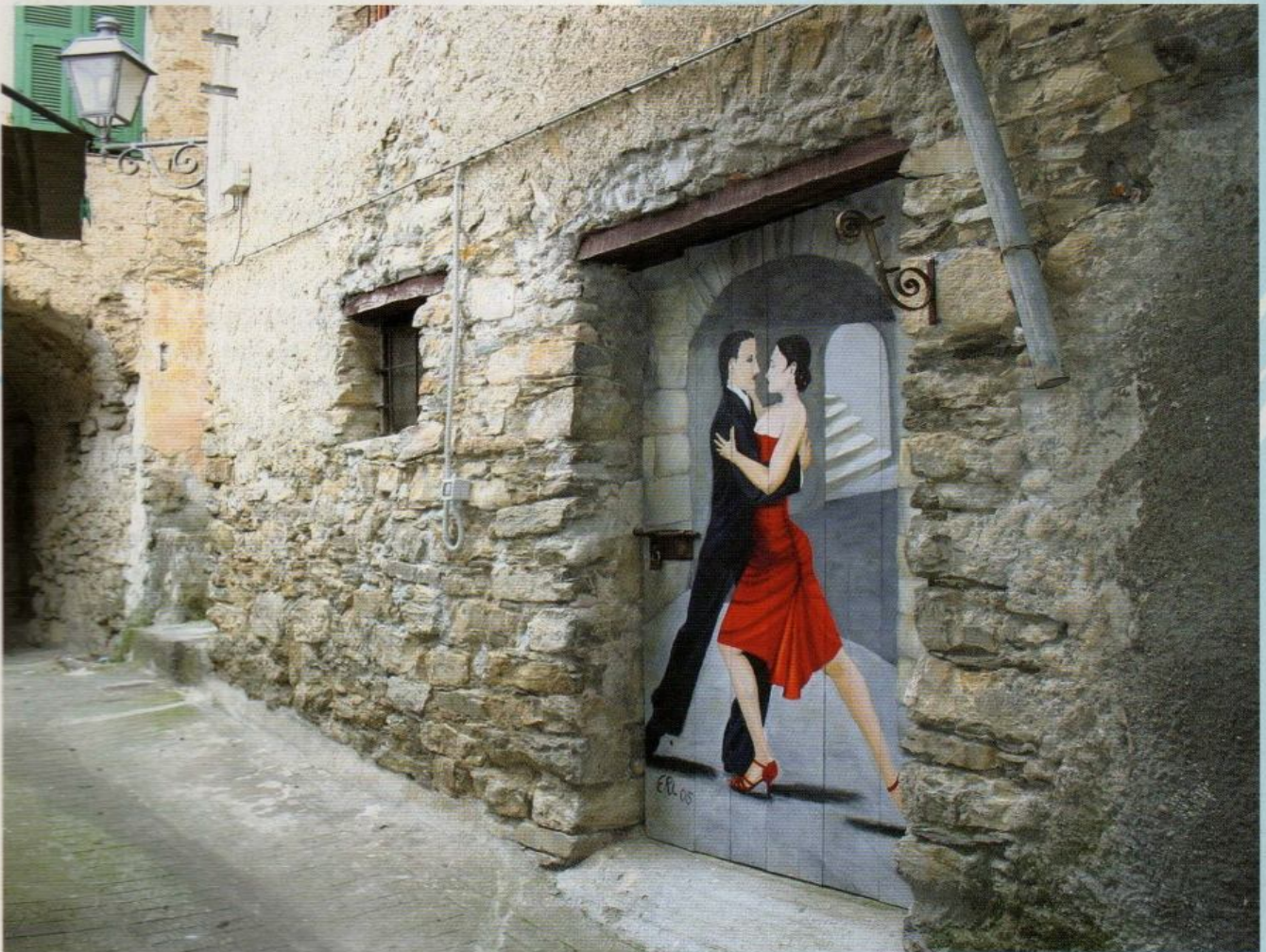
Tango Argentino Autore: Lindenblat Eva Raabe Anno: 2005